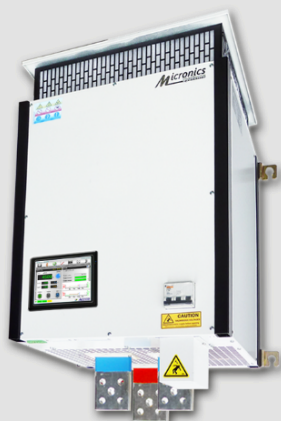
2x 1000A - 16V Coffret Mural IP23 L: 450 mm x P: 400 mm x H: 740 mm