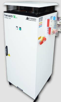
2x 3000A - 16V Mini Armoire IP43 L: 600 mm x P: 600 mm x H: 1400 mm